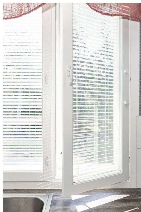
Tuuletusikkunassa on yksi kiintopainike.